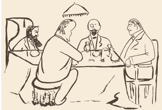
Un déjeuner des "Mousquetaires", dessin de Sacha Guitry

Ils étaient hommes de théâtre, auteurs, comédien grandiose, journalistes sportif et politique, chroniqueurs, académicien, inventeur, mondains, campagnards, citoyens, directeurs de théâtre... Ces hommes, qui s'appelaient entre eux "les Mousquetaires", sont les cinq doigts d'une des mains qui a porté l'esprit français jusqu'à nous. Un des passeurs, Sacha Guitry, résumait ainsi cette amitié : « Si le plafond s'écroulait sur les Mousquetaires, le lendemain il ferait presque nuit à Paris. »